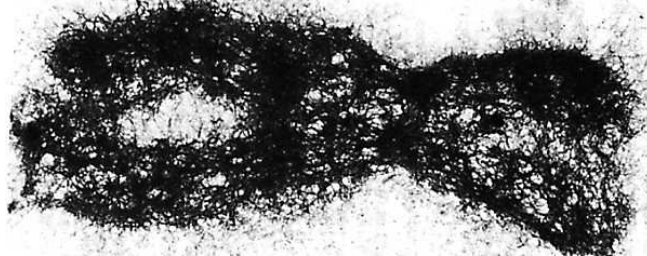
لاحظ بنية الصبغي الاستوائي.

الصبغة الصبغية: تعبر عن عدد الصبغيات وهي ميزة نوعية قد يرمز لها ب 2n أو ب n (أحادية أو ثنائية). الهستون: مكون من مكونات الخييطات النووية وهو عبارة عن بروتين يرتبط به خييط ADN ليعطي مظهر عقد اللؤلؤ للخييط.